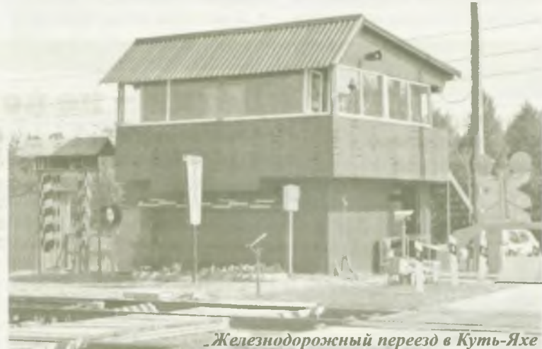
Железнодорожный переезд в Куть-Яхе